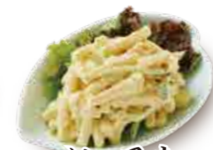
カレー風味マカロニサラダ 350円