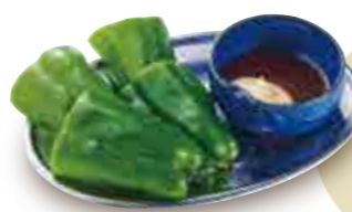
冷やしピーマン 350円