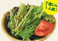
丁度いい1人前! ミニサラダ 200円