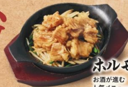
ホルモン炒め 790円 お酒が進む人気メニュー!