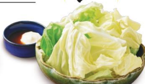
田中のキャベツ 280円 大阪風に田中特製味噌とマヨネーズをつけてお召し上がりください。