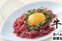
牛生ハムユッケ 680円 生ハムのユッケなので安心! 卵黄をからめてお召し上がりください。