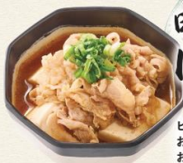
田中の肉豆腐 450円 ピリ辛味の田中特製肉豆腐。お好みで七味をかけてお召し上がりください。