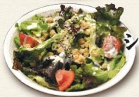
シーザーサラダ 640円