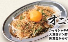
オニオンスライス 390円 シャキシャキのオニオンスライスと大葉をポン酢醤油でさっぱりと。卵黄をからめてマイルドな味わいに。