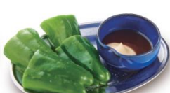
冷やしピーマン 350円