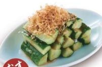
おすすめ 梅きゅうり 450円