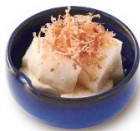
山芋の出汁酢漬け 390円