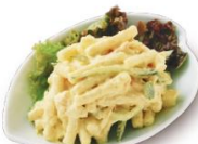
カレー風味マカロニサラダ 350円