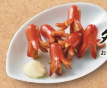
タコウインナー炒め 390円 お子様に人気の一品。