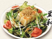
豆腐とじゃこの和風サラダ 640円