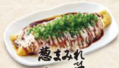
蕙まみれ チー串焼き 580円