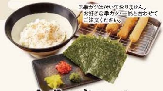
手巻き串セット 490円