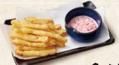
さきいかの天ぷら 580円