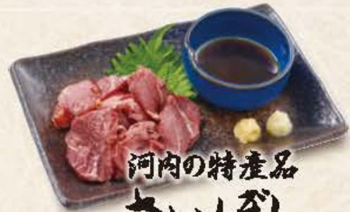
河内の特産品 さいやし 680円