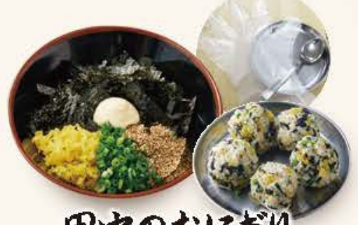
田中のおにぎり 580円