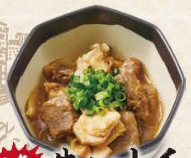
人気 牛おじ土手 580円