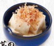
山芋の 出汁酢漬け 390円