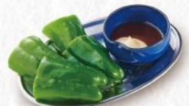
冷やしピーマン 350円