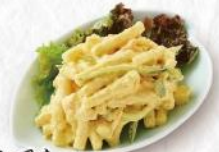
カレー風味 マカロニサラダ 350円