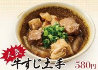
人気 牛すじ上手 580円 特製味噌で丁寧に煮込みました。 お好みで七味をかけてお召し上がりください。