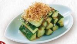
おすすめ 梅きゅうり 450円