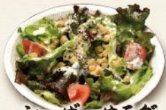
シーザーサラダ 640円