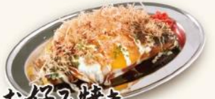
お好み焼き 目玉焼きのせ 600円 ふっくらお好み焼きにとろっと半熟目玉焼きが のったが「大阪名物」!