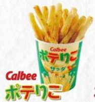
Calbee ポテリコ 390円