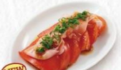
NEW ガリトマト 390円