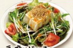
豆腐とじゃこの 和風サラダ 640円