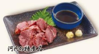
河内の特産品 さいばし 680円 「さいばし」とは馬肉を燻製にしたもの。 大阪府羽曳野市の特産品です。