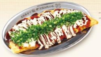
葱まみれチー平焼き 580円 大阪生まれの日経グルメ。とろとろたまごの中も外も葱まみれ! チーズとマヨネーズのコクがマッチした一品です。