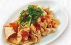
NEW ピリ辛豚メンマ 490円