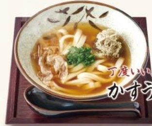
何度いってもミニサイズ! かすうどん小 420円

大阪・羽曳野の 油かす 油かすはホルモンから油を 搾ったもの。高タンパク、低脂 肪、コラーゲンたっぷりの伝統 食材です。大阪ではお好み焼 きや、おでんに入れたり、様々 な隠し味として使われます。 食品衛生法の基準に基づいた 清潔・安全な製造工場で製造 された油かすは、サクサクとし た揚げたての食感。油の質と 鮮度にこだわった商品です。