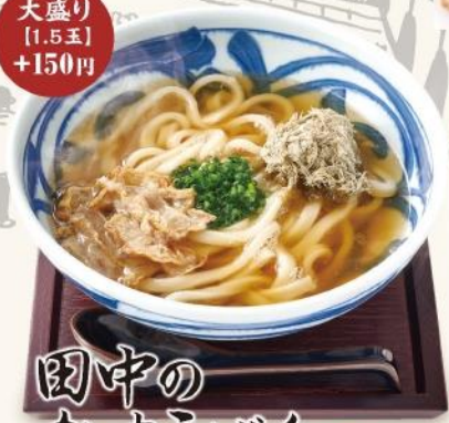
田中の かすうどん 730円

田中の名物は串カツと、この「かすうどん」。 田中特製のお出汁に油かすの旨味が溶け込んだ逸品。 大人から子どもまで優しく楽しむ味わいです。