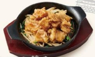
ホルモン炒め 790円 お酒が進む人気メニュー!