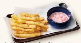
たきいかりの天ぷら 580円 特製の紅生姜マヨソースでお召し上がりください。